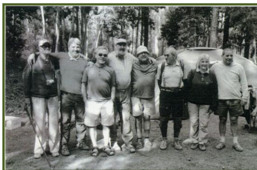
Ciento de años de montaña los contemplan.

El acceso al campamento lo haremos desde La Guancha. Accedemos desde la autovía del Norte por el P.I.R.S. Una vez recorrido la empinada pendiente y llegado al cruce general giraremos a la derecha donde a pocos metros, encontraremos una plaza pequeña a la izquierda, por detrás de la cual cogemos en pendiente. Llegado a una bifurcación cogemos a la derecha que nos indica hacia la zona recreativa. Una vez recorridos 2 ó 3 Kms por carretera, encontraremos a la derecha una amplia entrada de pista con una caseta de madera. Cogemos siempre en dirección ascendente esta pista que nos llevará a la casa forestal, donde giraremos a la derecha y en pocos minutos llegaremos a la nueva zona de acampada de El Lagar.